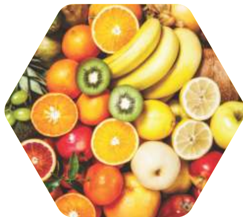
Polpas de frutas